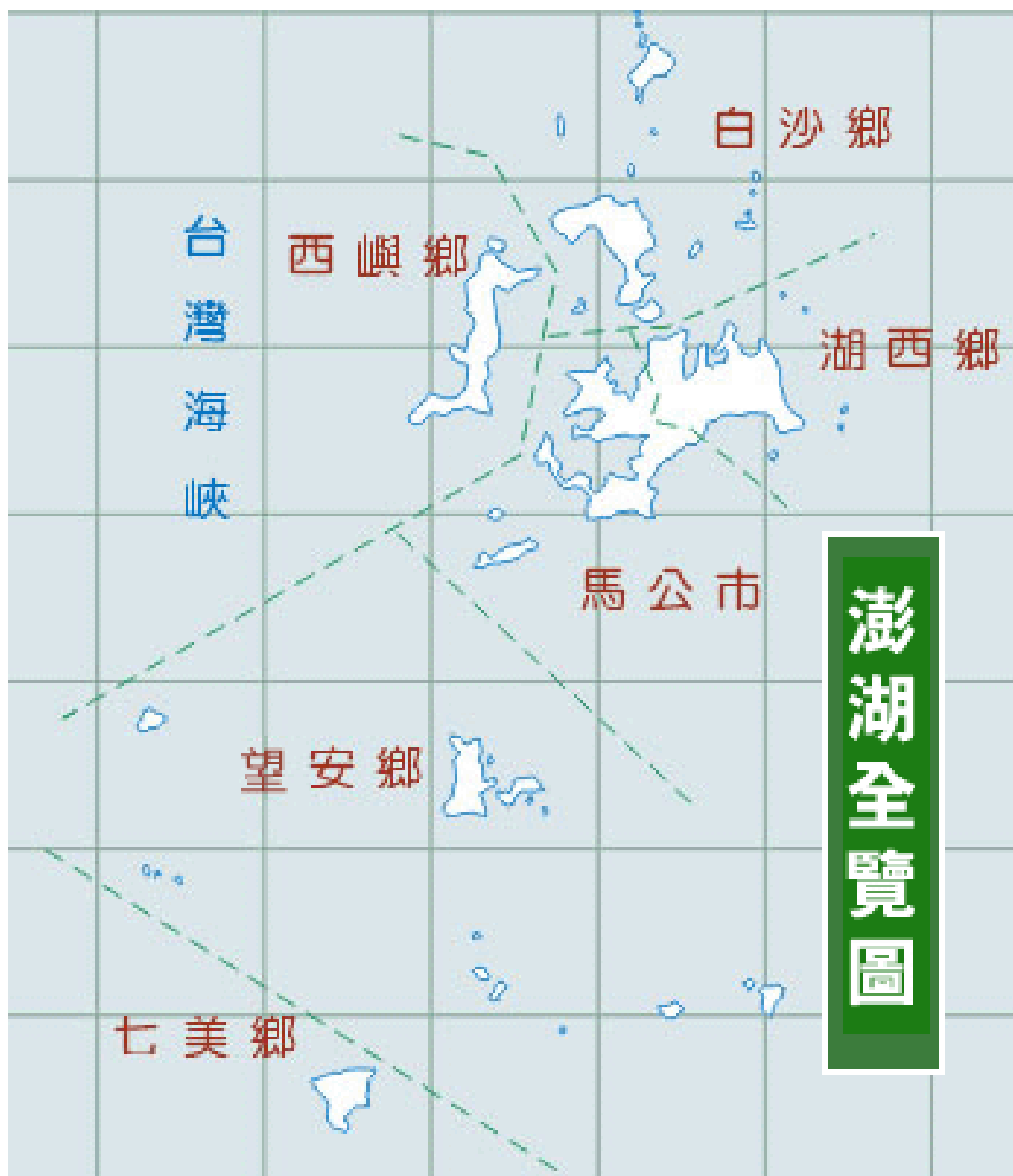
圖 4-1-1 澎湖縣行政區域圖