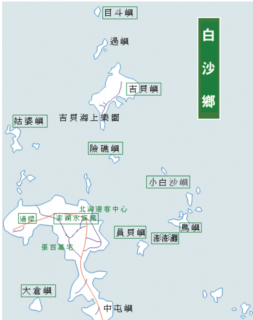
圖 4-1-4 白沙鄉區域圖

白沙鄉為澎湖縣之第二大鄉，請參照圖 4-1-4 以及分別由六個部份分析並說明：（一）行政地理位置（二）幼兒人口數統計（三）幼兒園所分布以及核准招生數（四）白沙鄉實施國民教育幼兒班之空間設備分析（五）白沙鄉實施國民教育幼兒班之師資分析（六）白沙鄉實施國民教育幼兒班之經費分析。