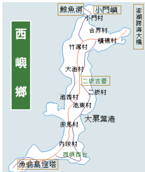
圖 4-1-5 西嶼鄉區域圖

西嶼鄉與馬公本島（即與白沙鄉、湖西鄉、馬公市）利用「跨海大橋」加以連結，使交通上能便捷相通，請參照圖 4-1-5。以下分別由六個部份分析並說明：（一）行政地理位置（二）幼兒人口數統計（三）幼兒園所分布以及核准招生數（四）西嶼鄉實施國民教育幼兒班之空間設備分析（五）西嶼鄉實施國民教育幼兒班之師資分析（六）西嶼鄉實施國民教育幼兒班之經費分析。