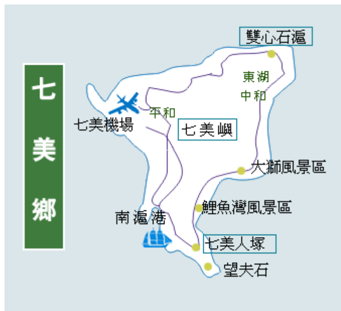
圖 4-1-7 七美鄉區域圖

七美鄉亦為澎湖縣之離島大鄉，所處位置較望安鄉距馬公本島稍遠。請參照圖 4-1-7 以及以下分別由六個部份分析並說明：(一) 行政地理位置(二) 幼兒人口數統計(三) 幼兒園所分布以及核准招生數(四) 七美鄉實施國民教育幼兒班之空間設備分析(五) 七美鄉實施國民教育幼兒班之師資分析(六) 七美鄉實施國民教育幼兒班之經費分析。