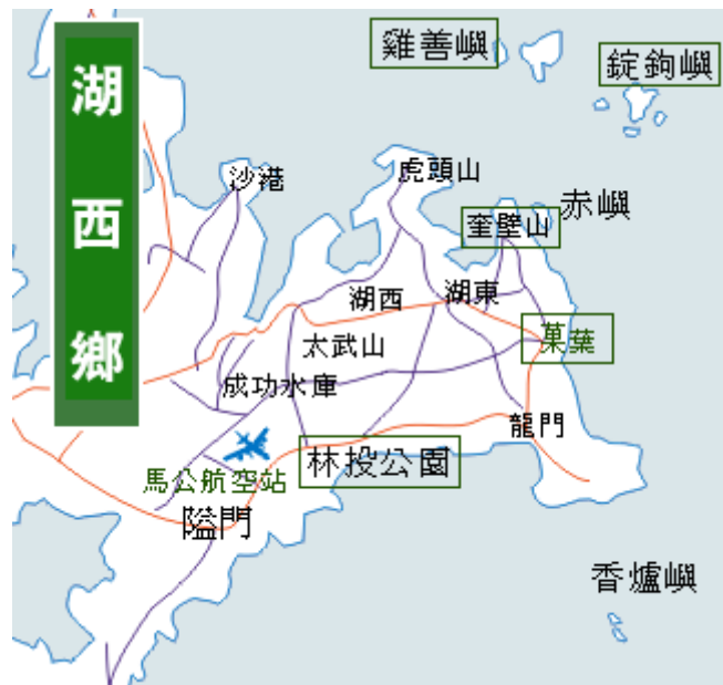
圖 4-1-3 湖西鄉區域圖

湖西鄉為澎湖縣之第一大鄉，請參照圖 4-1-3 以及分別由六個部份分析並說明：（一）行政地理位置（二）幼兒人口數統計（三）幼兒園所分布以及核准招生數（四）湖西鄉實施國民教育幼兒班之空間設備分析（五）湖西鄉實施國民教育幼兒班之師資分析（六）湖西鄉實施國民教育幼兒班之經費分析。