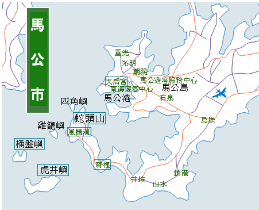
圖 4-1-2 馬公市區域圖

馬公市為澎湖縣之中心，請參照圖 4-1-2 以及分別由六個部份分析並說明：(一) 行政地理位置 (二) 幼兒人口數統計 (三) 幼兒園所分布以及核准招生數 (四) 馬公市實施國民教育幼兒班之空間設備分析 (五) 馬公市實施國民教育幼兒班之師資分析 (六) 馬公市實施國民教育幼兒班之經費分析。