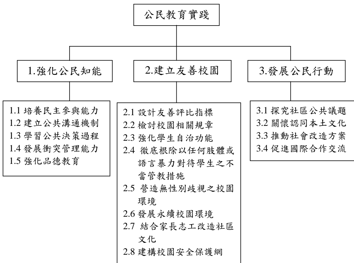
表二、公民教育實踐規劃